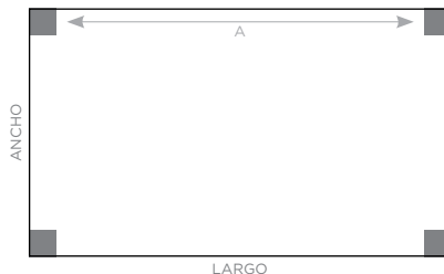
ALTURA 3,6 METROS 4 x EM90

Dimensiones | 9m x 6m x 3,6m Separación de altavoces | 9m (A)